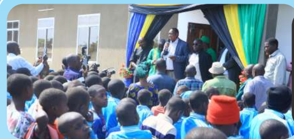
Waziri wa Katiba na Sheria akihutubia wananchi wa Bukokelo wilaya ya Rungwe jijini Mbeya.