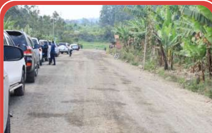
Mradi wa barabara ya Lwangwa-Kyejo inayojengwa kwa kiwango cha lami, iliyogharimu shilingi billion 6.1 ikikaguliwa.