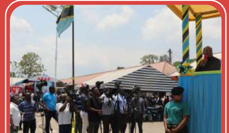
Waziri wa Katiba na Sheria Mh. Palamagamba John Kabudi akiongea na wananchi wa Tukuyu - Rungwe.