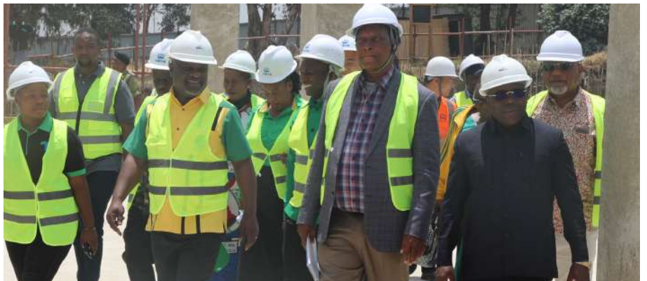
W aziri wa Katiba na Sheria Mhe. Palamagamba John Kabudi akikagua mradi wa chanzo cha maji klichopo katika eneo la Forest Jijini Mbeya.

Akijibu maombi hayo Waziri wa Katiba na Sheria Prof. Paramagamba Kabudi, amesema atazungunza na Waziri mwenye dhamana juu ya kuipandisha hadhi mamlaka hiyo kwakua haikinzani na maelekezo ya Rais ya kuzuia uanzishwaji wa maeneo mapya ya utawala kwa sasa.