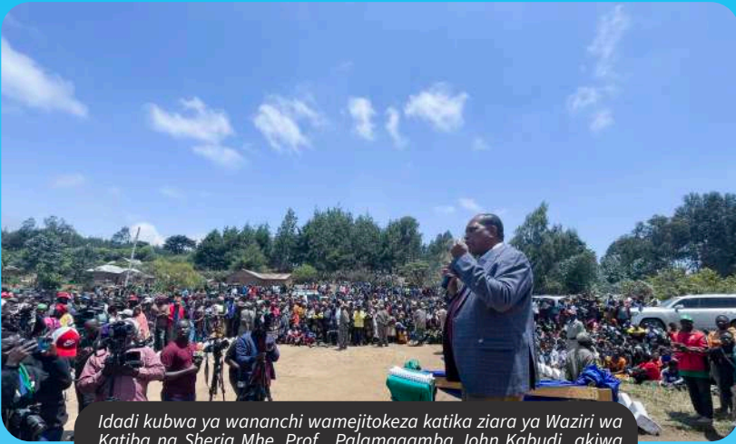
Idadi kubwa ya wananchi wamejitokeza katika ziara ya Waziri wa Katiba na Sheria Mhe. Prof. Palamagamba John Kabudi akiwa ameambatana na na Mkuu wa Mkoa na wataalam mbalimbali kutoka mkoani na taasisi.