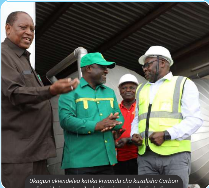
Ukaguzi ukiendelea katika kiwanda cha kuzalisha Carbon dioxide inayotumika katika viwanda mbalimbali vya kutengenezea soda na bia.