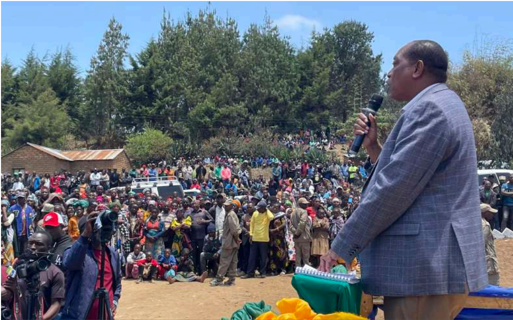
W aziri wa Katiba na Sheria Mhe. Palamagamba John Kabudi akiongea na umati wa watu waliojitokeza kumsikiliza katika kijiji cha Santila kilichopo kata ya Mbalizi.