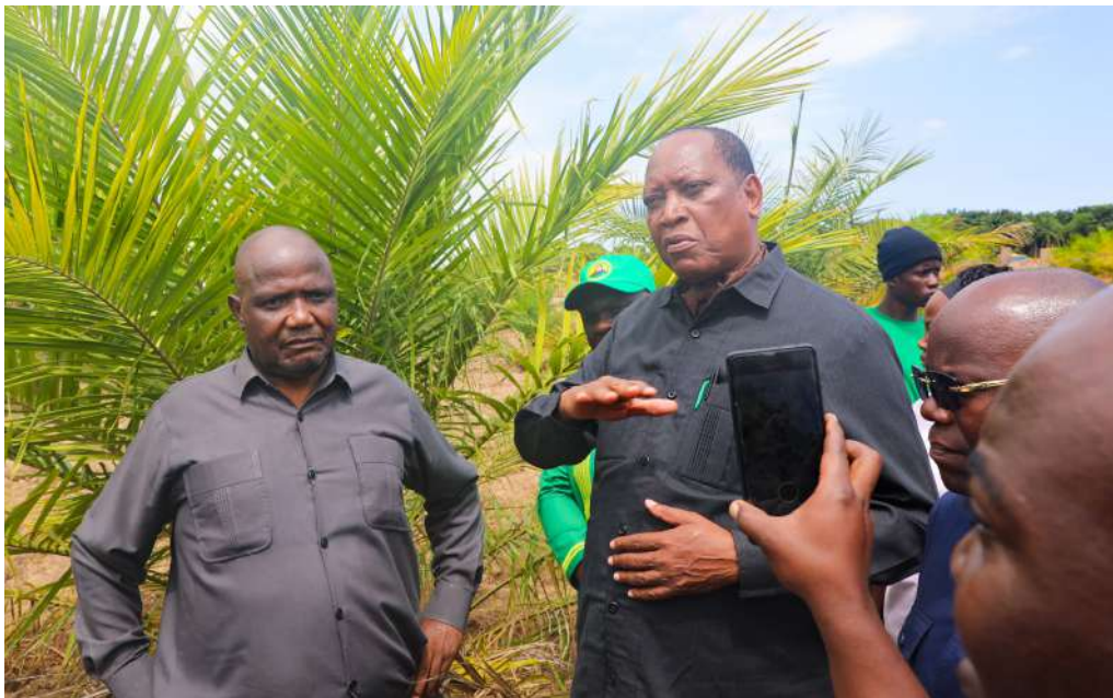
W aziri wa Katiba na Sheria Mhe. Palamagamba John Kabudi akikagua shamba la michikichi ambapo serikali imetoa ruzuku ya miche ya kisasa ya michikichi kwa lengo la kuhamasisha zao hilo.

ili kuwarahisishia wananchi kusafirisha mazao yao.