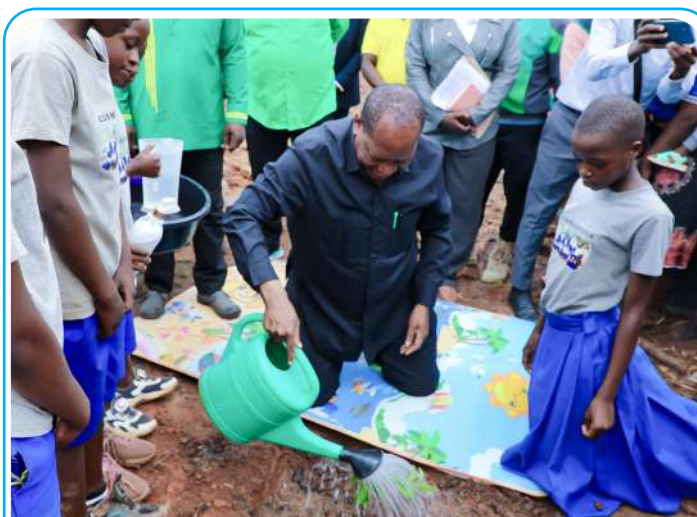
Waziri wa Katiba na Sheria, Prof. Palamagamba John Kabudi akimwagilia mti alioupanda mara baada ya kuzindua bweni hilo la wanafunzi wa kike wenye mahitaji maalumu.

“Nimeambiwa bado Sh. Milioni 30 kwa ajili ya kukamilisha jengo hili, mkurugenzi hakikisha unaleta fedha hizo haraka ili jengo likamilike, mwezi januari jengo lianze kutumika, hakuna kisingizio hapa,” amesema Prof. Kabudi.